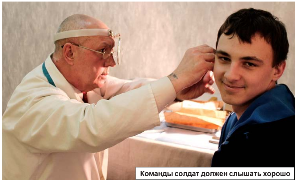
Команды солдат должен слышать хорошо